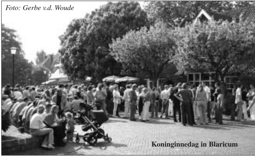
Koninginnedag in Blaricum