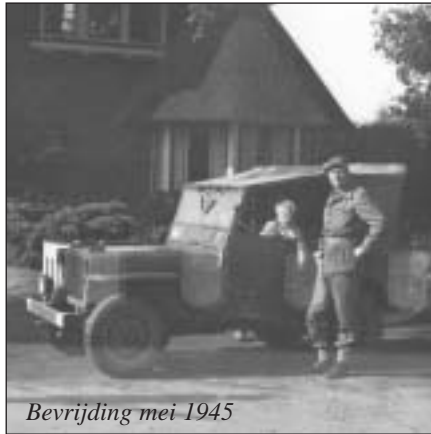
Bevrijding mei 1945

“Mammie, waar is pappie?” “Weten we niet.” Moeder is alleen thuis. Met de drie jongens. Haar twee Duitse zwagers en haar vader komen op bezoek, Duitse officieren in uniform. Zij wordt niet veroordeeld door haar omgeving. Nee, die weet wel beter. Steunt haar. Haar jongste Duitse zwager zit als hoge officier in het verzet tegen Hitler. Hij ontsnapt, en overleeft het maar net. Wil daarna nooit meer iets van het leger weten. Dat hoorde de kleine jongen pas na de oorlog. Hij is trots op zijn vader en zijn moeder. En op die ene oom. En houdt van ze.