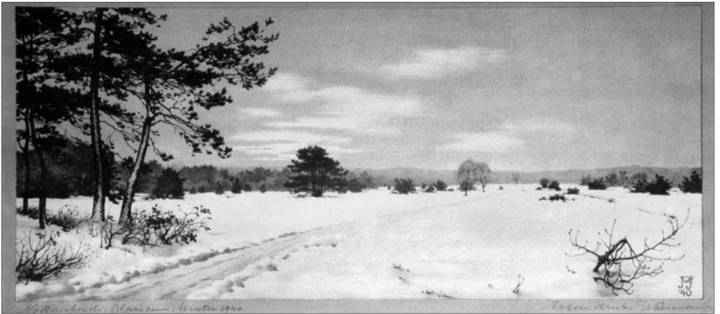
'Jan Voerman' Noorderheide Blaricum, winter 1940 (Tafelbergerheide van de Tafelberg gezien richting Crailo, nu de Boisserainweg)