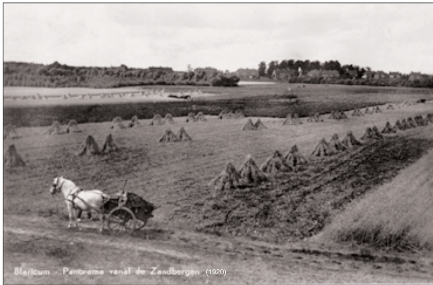
Blaricum - Panorama van de Zandbergen (1920)