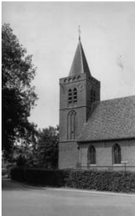
De Dorpskerk in 1958