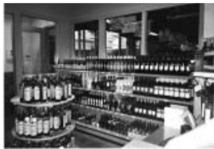
Na de renovatie

De bakkerij heeft verse broodjes die je per stuk zelf mag inpakken. Heerlijk vers gebak dat je eventueel ook een dag tevoren kunt bestellen. Vooraan in de winkel is een voordeeltstraat waar alle aanbiedingen bij elkaar staan en je nog goedkoper terecht kan. De slagerij is uitgebreid met