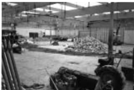
Tijdens de renovatie

Op vrijdag 6 oktober 2006 beleven we de laatste dag van het oude gebouw dat kreunt en steunt op zijn voegen. De laatste dag met om het uur steeds hogere kortingen op alle artikelen die zich nog in de winkel bevinden. Om 10.00 uur is er nog weinig te doen, maar om 15.00 uur zijn er al vele wachtenden die om 16.00 uur gebruik willen maken van 50% korting. Alle boodschappenwagentjes en alle mandjes zijn in gebruik. Jan Driessen deelt zelfs vuilniszakken uit om de gekochte levensmiddelen te vervoeren. De artikelen die na deze verkoopstunt nog over zijn, passen makkelijk in enkele kratten! Het is schitterend weer als op 9-10 oktober het oude lekkende dak wordt gesloopt en een nieuw dak wordt geplaatst. Kassa's worden afgevoerd, muren worden ontdaan van schappen en strippen. Diepvrieskasten zijn al eerder verdwenen. Op 11 oktober rijdt een kleine bulldozer over de vloer om alle vloertegels te strippen en op een hoop te vegen. Op 16 oktober wordt de nieuwe tegelvloer gelegd. Lange rijen tegels worden met de hand gelegd. Er komt geen machine aan te pas. Slechts een touwtje en een 'timmermans-oog' geven de 800 m 2 vloer een imposant uiterlijk. De nieuwe uitbreiding aan de achterkant van de winkel beslaat nog eens ca. 300 m 2 en geeft ruimte aan magazijn met daarboven kantine, machinekamer en