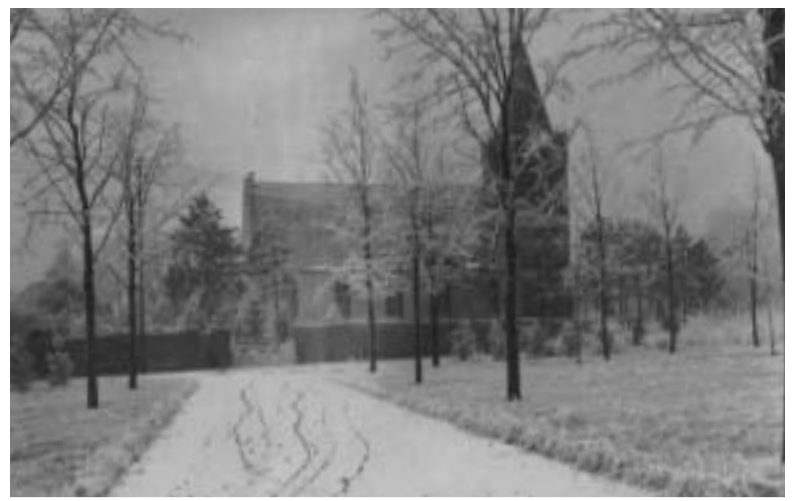
De Dorpskerk in 1929