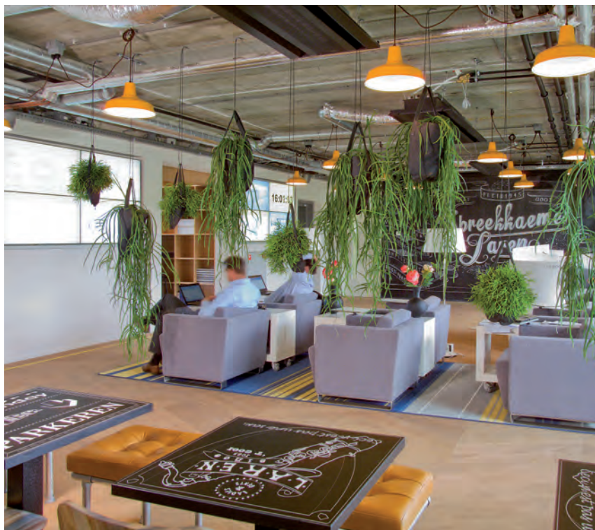
De huislijke en comfortabele sfeer ontstaat door gebruik van hout, hangende planten en tapijten.

Laren Jazz is een samenwerking van Singer Laren, Lions Club Crailo en Rotary Club Laren-Blaricum. Naast het neerzetten van een aansprekend en sprankelend jazzfestival heeft Laren Jazz tot doel het ondersteunen van musici met een beperking.