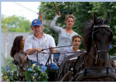
Ringsteken met aanspanningen 2011