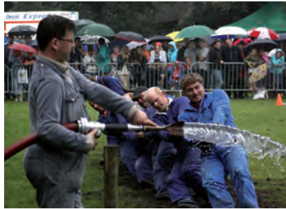
Foto's volksspelen 2011