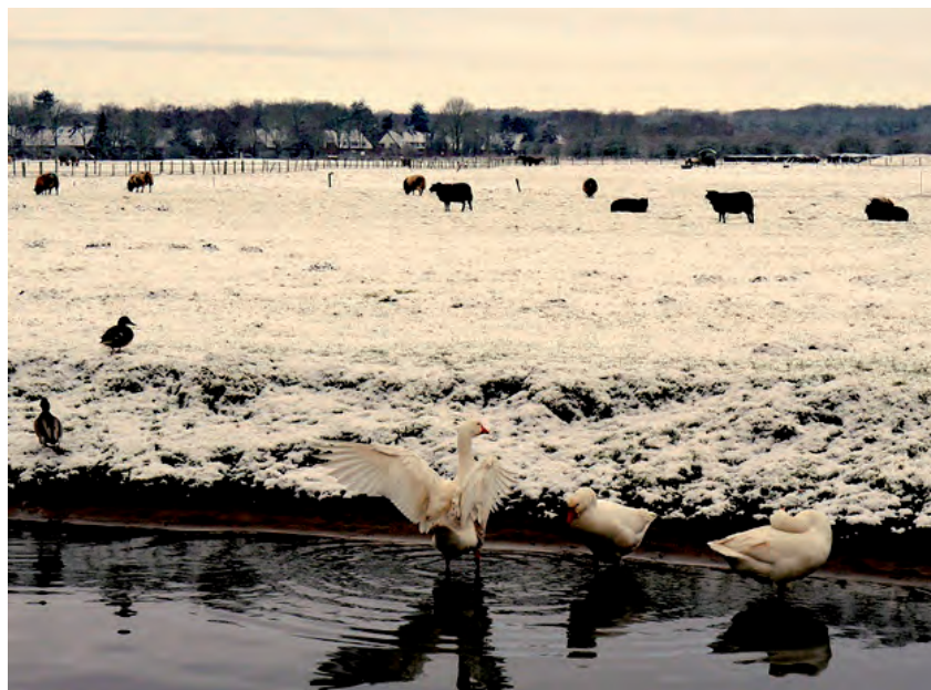
Op de Goyergracht de beroemde Bijvanck-ganzen, bijna weer op hun oude stek.