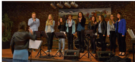
Iedere vrijdagavond repeteert jongerenkoor Shine in de Dorpskerk