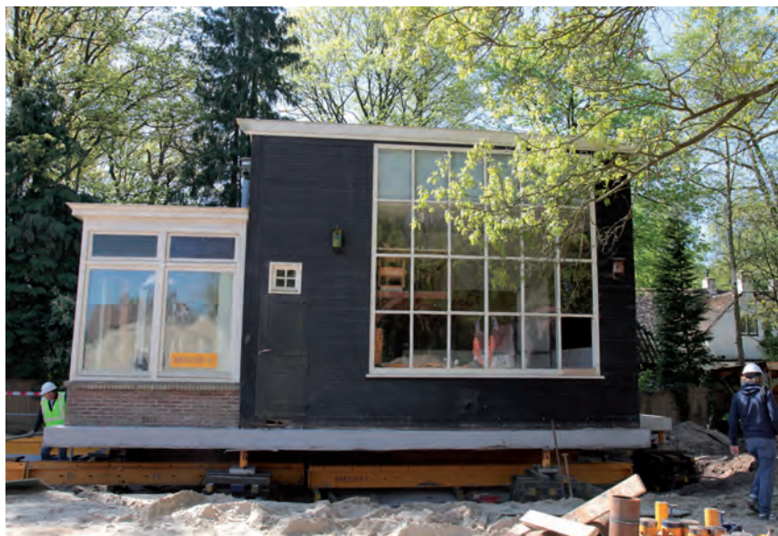
Het vogelnestje waar nu een koolmeesje in nestelt wordt mee verplaatst met het atelier van kunstschilder Ferdinand Hart Nibbrig.