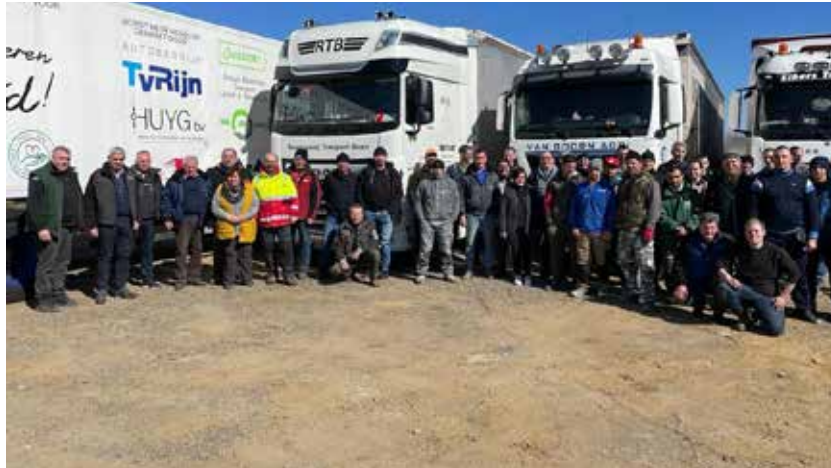
Hulpkonvooi met twaalf chauffeurs

de vele vluchtelingen op te vangen. Er werd al heel snel een burgercomité Blaricum opgericht, waar hulp in welke vorm dan ook aangeboden kan worden via burgercomiteblaricum@gmail.com .