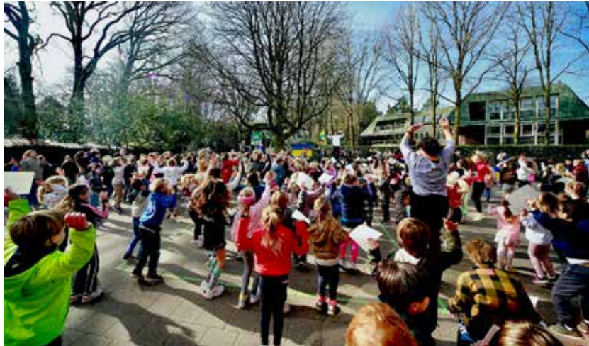
OBB doet sponsorloop