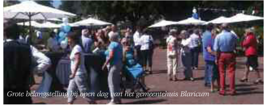
Grote belangstelling bij open dag van het gemeentehuis Blaricum

Zo'n zevenhonderd belangstellenden hebben zaterdag 5 juni tijdens de open dag een bezoek gebracht aan het nieuwe gemeentehuis van Blaricum. Het gebouw was de dag ervoor officieel geopend.