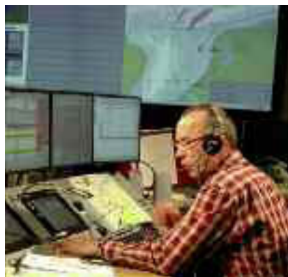
Kustwachtcentrale Den Helder

onderkoeling voorkomt, waar een zeiler die in een ‘normale’ outfit te water raakt het hooguit een half uurtje uithoudt. Daar komen nog bij: een helm met ingebouwde communicatieapparatuur van 500 euro en een hoogwaardig reddings-