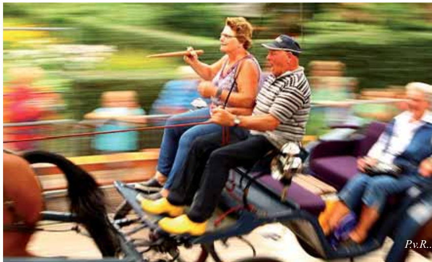
Spanning bij ringsteken op de Kerklaan tijdens de kermisweek 2010