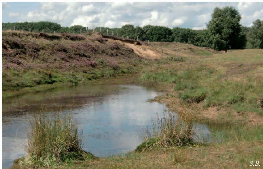
't Harde: de oeverwaluwenwand