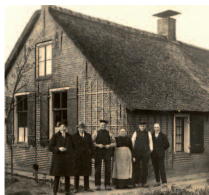
De beide broers met Teuntje

In hun kennissenkring was ook een Rigter die een zwerfend bestaan leed. Het schijnt dat hij nog al eens bij de gebroeders Rigter op bezoek kwam. Hij kreeg daar dan wat eten en wat geld en ging dan weer verder. Zo ook op dinsdag 23 maart 1924. Ook die dag moet hij daar zijn geweest en kreeg hij wat geld mee. Die middag moet het erg geregend hebben en toen hij te voet in Baarn was beland, vroeg en kreeg hij onderdak in de cel. Het was toen gebruikelijk dat men vanaf 's avonds negen uur bij de politie onderdak kon krijgen. Maar omdat het zo regende gaf men dit onderdak eerder op de dag. Hij moet ook nog brood en koffie gehad hebben en zijn ingeschreven, en werd die middag om zes uur opgesloten. Het nachtverblijf moet 20 meter van het toenmalige politiebureau hebben gestaan. Deze man kwam meer in Baarn en was er een beetje bekend. Het was ook iemand die iedereen groette en was daardoor een bekend figuur in