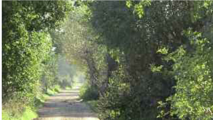
Herfst langs de Gooiergracht