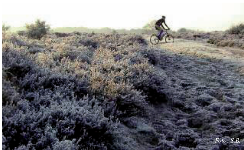
Op de Tafelbergheide eind november 2010.

Voor zowel eenmalige als doorlopende projecten zoekt de ASB vrijwilligers voor meer boerderijtuinen in het dorp, het onderhoud en beheer van het Warandepark, de ontwikkeling van een cultuurhistorisch wandelpad in het Warandepark, het bijhouden van de website en het werven van donateurs. De ASB is eigenaar van twee boerderijen en van circa 80 hectare aan weilanden, akker- en natuurgronden. De weilanden (de meenten) bevinden zich voornamelijk bij 't Harde, achter de Capitten en in de Eemnesserpolder. De akkergronden liggen in de enghen, aan de Noolseweg en de Huizerweg/Bergweg. De dertien nog actieve Blaricumse boeren houden koeien en schapen, en doen aan paardenstalling. Op de akkers worden asperges, maïs en rogge verbouwd, zonnebloemen geteeld en ook het traditionele boekweit gecultiveerd. Hiermee wordt een belangrijke bijdrage geleverd aan de levendigheid en de eigenheid van het dorp Blaricum. U kunt u hieraan ook een bijdrage leveren, als vrijwilliger, of door vriend te worden van de ASB. Voor informatie en contact: tel. 5334894, e-mail info@a-s-b.nl respectievelijk a-s-b.nl .