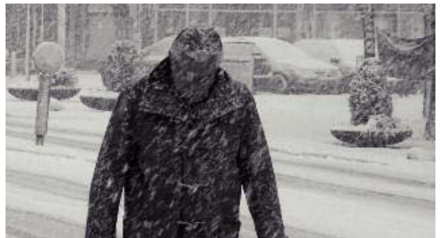
Houtje touwtje dicht

Zon op en onder: op 1 februari, 6.21 respectievelijk 17.27 uur, op 28 februari om 7.29 respectievelijk 18.17 uur.