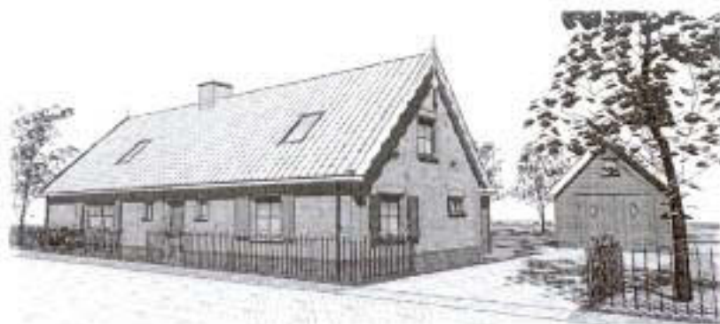
Het nieuwe pand op de Meentweg 9

Het oude dorp is een stukje zeer kostbaar antiek dat in de toekomst steeds zeldzamer zal worden, aldus Bart de Leeuw, geboren en getogen in Blaricum en al jaren gepassioneerd aan het bouwen en restaureren van bijzondere objecten, eerst met De Leeuw Vastgoed en momenteel met Exclusive-Home Projecten .