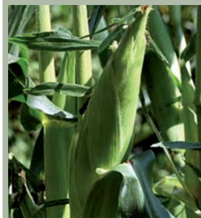
Subsidie voor intensieve teelten zijn uitgesloten, zo ook voor maïs.

'Een recente oproep om vrijwilligers te betrekken bij het agrarisch beheer maakt bovendien onderdeel uit van het bewust en voorzichtig recreatief gebruik van het gebied. Toezicht en handhaving met respect voor de agrarische en voor de natuurbelangen zijn daarbij uitgangspunt. Wij hopen dat de vereniging Vrienden van 't Gooi zijn strijd staakt.'