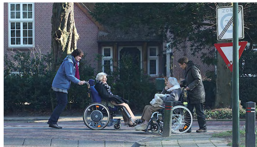
Lekker zo, he? Ja hoor...

Deze foto is gemaakt door Peter van Rietschoten op 18 februari bij het Oranjewitje op de Torenlaan, vlakbij de Torenhof.