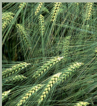
Gerst bijvoorbeeld zorgt voor een waardevolle akkerflora.

De VVG verzoekt de raad tenslotte ondermeer: 'In overleg met de ASB te komen tot een passend beheer van alle genoemde gronden voor zover in eigendom en beheer bij de ASB gericht op de in het NBP geformuleerde natuurdoelen en daarbij het huidige daarmee in strijd zijnde gebruik op termijn te beëindigen. Wij zijn graag bereid ons verzoek in een openbaar rondetafelgesprek van uw raad toe te lichten.'