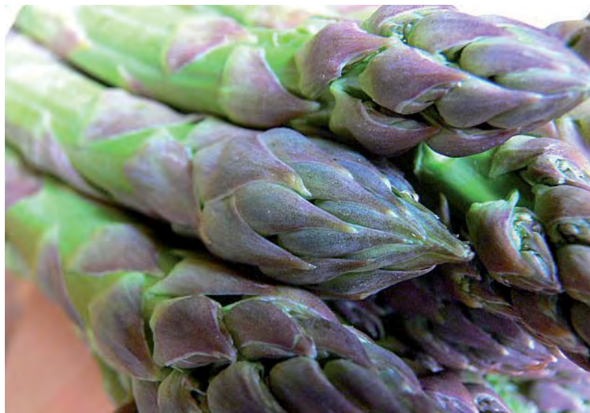
De asperge valt onder de schadelijke intensieve teelten en daarom zal dat moeten leiden tot afbouw, concludeert de VVG uit het Natuurbeheerplan.