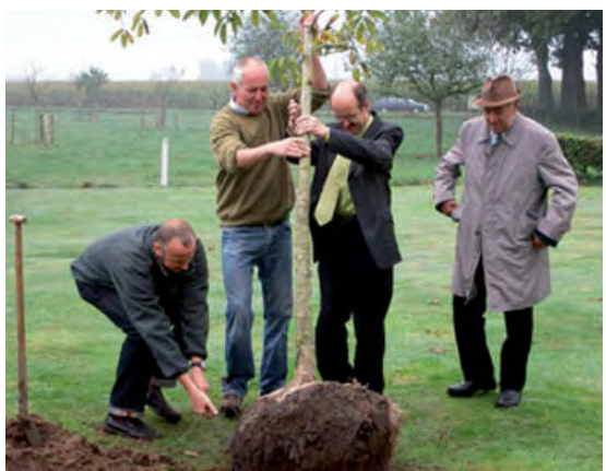
Wordt het een boom voor het Stichtsepark of een droomboom?

Men was er wel van op de hoogte en vond het getuigen van een slordig beleid in deze. Dat veroorzaakte dan ook de ergernis. Erkennen dat er zaken niet