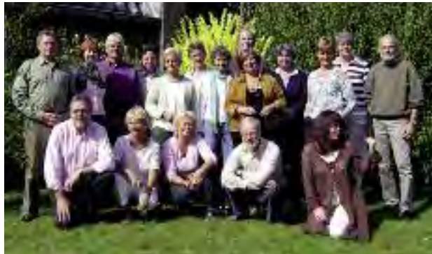
Het Goylants Kamerkoor

Het Goylants Kamerkoor, dat al vaker heeft gezongen in de Sint Vituskerk, is