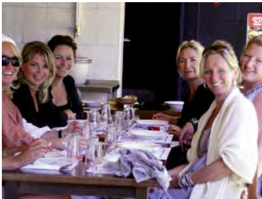
Het Spiribiza principe: 'aan de innerlijke mens wordt gedacht'.

De oudste Zuster Dominicanes van de Heilige Familie te Neerbosch, Nijmegen. Geboren in Blaricum, in het grote gezin van 'meester' Van Gils. Ze had een werkzaam leven; het onderwijs vervulde haar hart, maar ook heel Blaricum volmaakte haar leven, zoals ook de Missie in Suriname dat deed. De Zusters Dominicanessen, maar ook haar familie en vele vrienden zullen haar met genegenheid herdenken. Een kleine, pit-tige vrouw met een gouden hart.