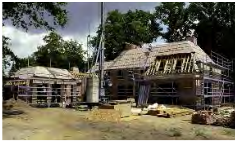
Als je perceel in een archeologisch gebied ligt en je wilt (ver)bouwen moet er archeologisch onderzoek worden gedaan onder het motto 'de verstoorder betaalt'.

Archeologie in Blaricum? Jazeker. We vergeten dat wel eens. Duizenden jaren geleden vestigden zich hier de eerste mensen. Jagers en vissers. In de steentijd. Hier, aan de noordelijke uitloper van de meer dan honderd kilometer lange stuwwal uit de ijstijd.