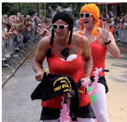
Taxi Blaricum in de bocht, kermis 2009

Dit jaar is de populaire Blaricumse kermisweek van zaterdag 20 augustus tot woensdag 24 augustus 2011 op diverse locaties.