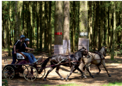
Wedstrijden Stad en Lande Ruiters 2011