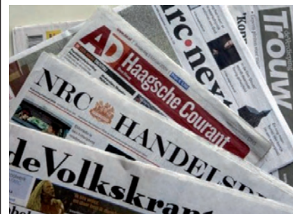
Het dagelijks krantje

Een paar keer per week kom ik in de bibliotheek in Laren. Mijn eerste gang is naar de leestafel met de landelijke en regionale kranten en de tijdschriften. In stilte tref je lezers die voor hun dagelijks krantje komen. Bij de publiekscomputers kun je meer dan 1000 kranten lezen in 39 talen. Na de krant naar de boeken. Als ik niet vind wat ik zoek, reserveren of bestellen uitermate vriendelijke medewerkers wat ik wil hebben. Nog even kijken bij de toptitels van de bestsellers, wat er te zien is in de expositieruimte en wat voor films er komen. Voor je het weet is er een uur om. In het jaarverslag 2010 van de Bibliotheek Huizen-Laren-Blaricum lees ik dat vorig jaar de vestiging Huizen 190.000 bezoekers had en Laren 62.000. Geen wonder!