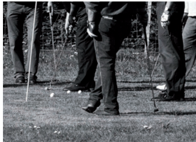
Blaricum Golf & Country 2010

25 september Dag van het werkpaard, info: www.dagvanhetwerkpaard.nl