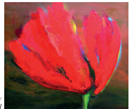
Red Mary by Bella Tchicourel

Het Blaricums Gemengd Koor zoekt nieuwe leden voor alle stemgroepen. Ervaring is wenselijk, maar niet per se noodzakelijk. Repetities zijn iedere woensdagavond 19.45-22.00 uur in De Blaercom. Info: www.bgk-koor.nl