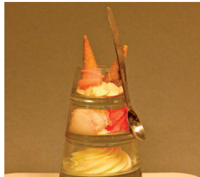
De coupe Upside Down