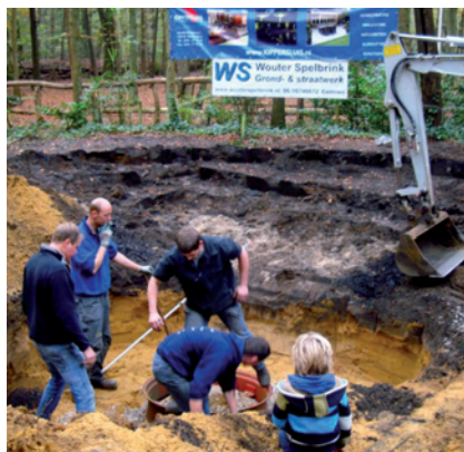
Werkzaamheden bij de kampvuurkuil

In het bijzijn van leiding, leden, oud-leden, ouders en andere belangstellenden zijn de werkzaamheden aan de nieuwe kampvuurkuil van Scouting Raboes feestelijk van start gegaan. Om geld in te zamelen voor de nieuwe kampvuurkuil heeft Scouting Raboes een ludieke actie gestart. Iedereen kan voor €10,- een paaltje voor de nieuwe kampvuurkuil sponsoren. In totaal zijn er 800 paaltjes nodig. Meer over het sponsoren van de kampvuurkuil van Scouting Raboes en het prijzenpakket is te vinden op www.raboesblijdenstein.nl . Info: kuil@raboesblijdenstein.nl .