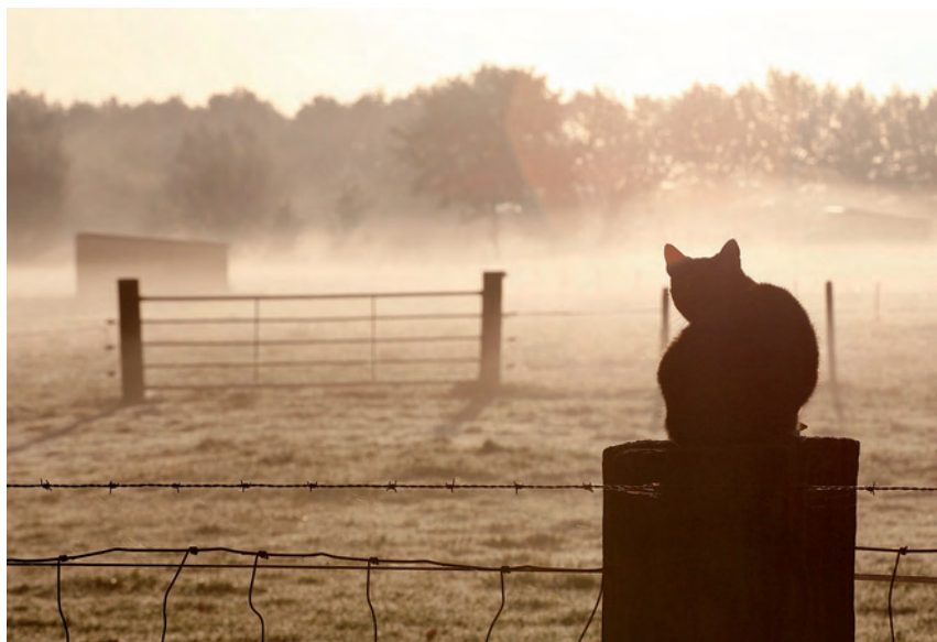
Tjerk Visscher: 'Ik fietste 's morgens op de Schapendrift en daar zat een poes op een paal te genieten van het uitzicht. De dauw met opkomende zon.'