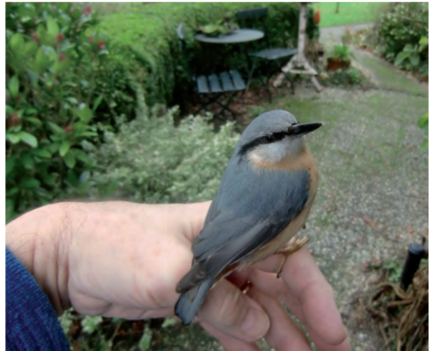
Zie ook zijn column op pagina 2