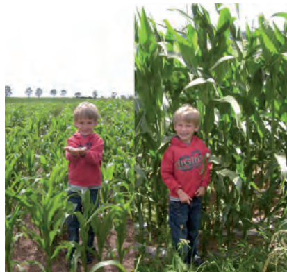
Het verschil in mais onder folie en het mais van de buurboer is goed te zien

paar maanden op. We hebben behoorlijk wat bekijks gehad, vooral tijdens het oogsten liep het storm! Tijdens het voorbereidende ploegen moest twee maal de Explosieven Opruimingsdienst komen omdat Henk een propagandabom en twee dagen later een mortiergranaat had opgeploegd. Als gevolg van de slag bij Losheimergraben (Ardennenoffensief) is na de oorlog alleen al in de weilanden