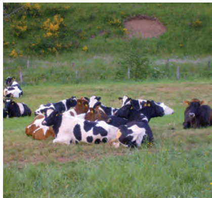
De pinken, waarvan de rechter van Monique is: koe Liebschen

dak van de naastgelegen boerderij die tegen onze poort is aangebouwd, is toen meer dan een meter opgetild en teruggevalen. De planken van de hooizoldervloer stonden recht overeind, ramen en deuren waren naar binnen gezogen. Een vrouw die 300 meter verderop woont, stond in haar tuin toe te kijken hoe onze daken omhoog kwamen. Haar man kon haar net op tijd naar binnen trekken; een paar seconden later sloegen stukken van het dak van de kal-