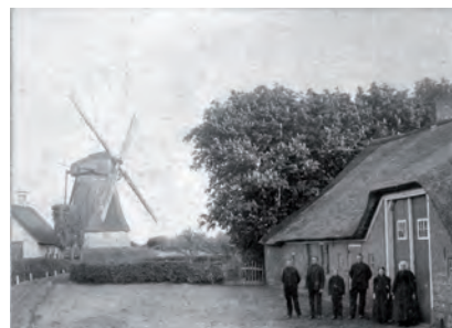
De boerderij aan de Tweede Molenweg