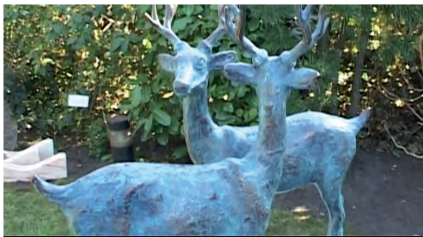
Deze video is openbaar.

Still uit een video gemaakt door Laura Elsman