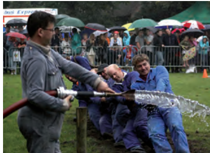
Foto's volksspelen 2011