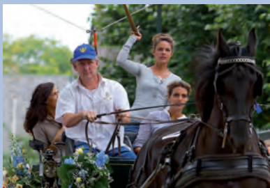
Ringsteken met aanspanningen 2011