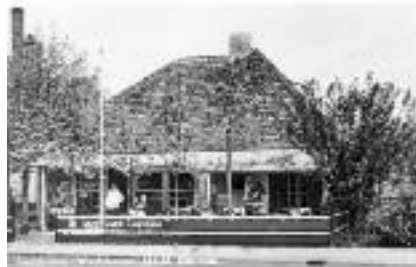
De lunchroom aan de Huizerweg