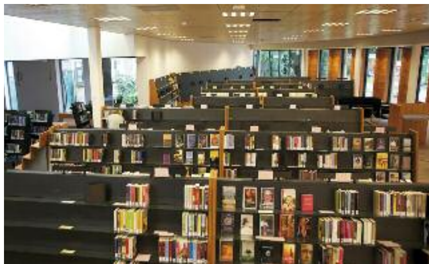
Boek voor boek

'Mijn 2 dochters van bijna 9 en 7 gaan naar de Larense Montessori school, vanaf het moment dat mijn oudste naar school ging ben ik betrokken bij de