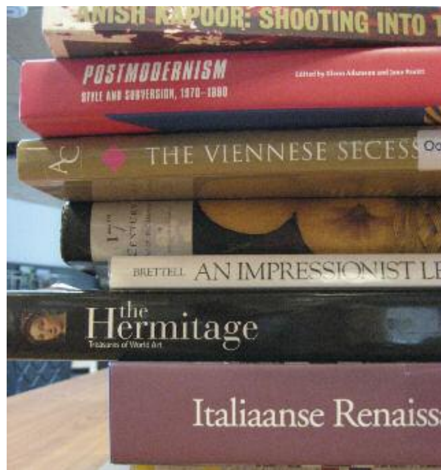
Prachtige collectie kunstboeken.