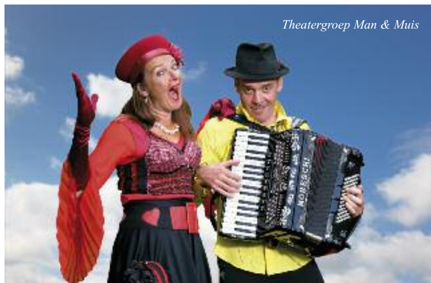
Theatergroep Man & Muis