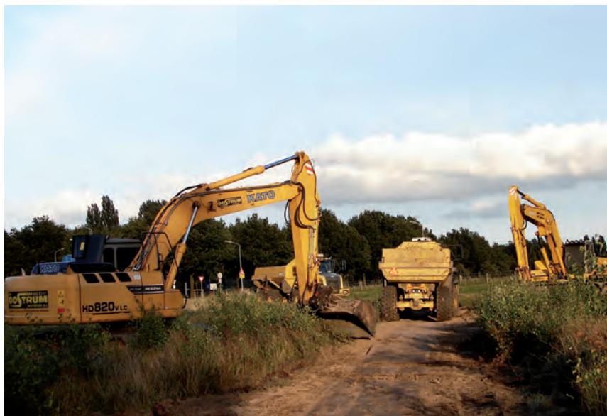
Graafmachines aan het werk bij de Groeve Oostermeent