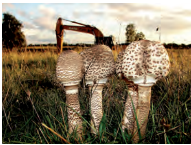
Parasolzwammen vragen zich af wat er met hen gaat gebeuren

Het effect hiervan is dat uit de bodem kwellend grondwater minder snel uit het gebied wegstroomt en vochtminnende, veelal zeldzame planten, zoals klokjesgentiaan, kleine zonnedauw, grote wolfsklauw en veenpluis zich kunnen handhaven en zelfs uitbreiden. Naast het dichtleggen en dempen werden de sloten op enkele plaatsen juist uitgediept. Tevens werden er een aantal poelen aangelegd. Deze plekken zijn vooral bedoeld voor kikkers, padden en salamanders.