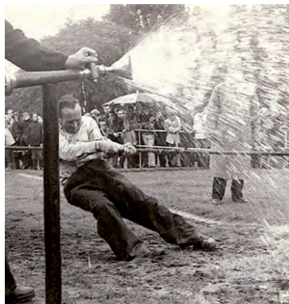
Touwtrekken in 1962

Van 22 tot en met 26 mei 2013 zijn er festiviteiten rond het 75-jarig bestaan van de Oranje Vereniging. Kijk voor meer informatie en foto's op www.ovblaricum.nl .