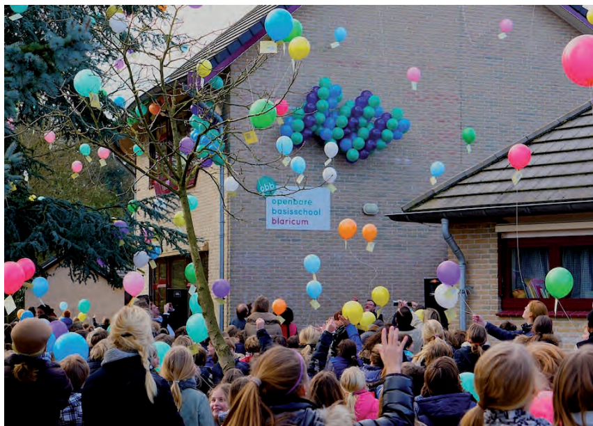
OBB-naambord onthuld – Op 20 februari is op feestelijke wijze het naambord van de OBB onthuld, 10 jaar na ingebruikneming van het gebouw.

Dit kan alleen door vooraf een afspraak te maken via het landelijk afsprakenbureau, telefoon: 085-4883616. Zelf een datum plannen kan via de website www.regelzorg.nl . Tarief: € 35,- voor de B/E keuring en € 52,50 voor chauffeurs jonger dan 70 jaar met groot rijbewijs. Info: www.goedkopekeuringen.nl .