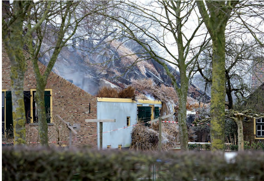
Beeld na de rietkapbrand op 22 maart jl. in Eemnes

Hierbij nodigt de Stichting Dorpsblad Blaricum (hei & wei) de inwoners van Blaricum uit voor de jaarvergadering op 6 mei om 21.00 uur in De Blaercom. U bent van harte welkom!