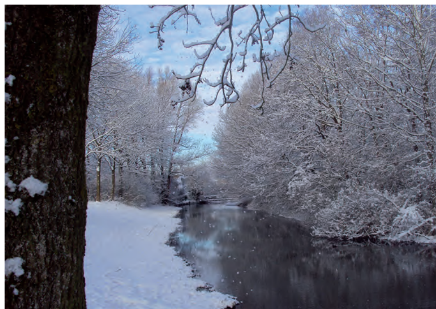
Winter in de Bijvanck

Heeft u een mooie, absurde, of gekke foto, stuur deze dan voor 24 april in hoge resolutie naar redactie@heienwei.nl , onder vermelding van uw naam, waar en wanneer de foto is gemaakt en een leuk fotobijchrift.