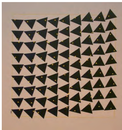
'Movement 1 yellow in black'

Theo was autodidact, werkte met verschillende materialen en liet zich inspireren door het surrealisme en het impressionisme, maar dit alles met een eigenwijze draai. Hij heeft in 2005 geholpen met het organiseren van de eerste Open Atelier Route Blaricum. Vorig jaar stond hij in De Malbak met werk tijdens Bijvanck in Beeld en zijn laatste tentoonstelling, die liep tot 16 januari 2013, was in het BEL-kantoor. Bij leven schonk hij een schilderij aan De Malbak, Movement 1 yellow in black , helaas heeft hij zelf de officiële overhandiging op 7 maart jl. niet meer mee mogen maken. Theo Jacobs overleed 11 februari op 63-jarige leeftijd.