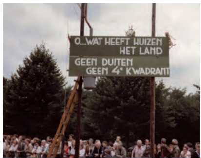
De volksspelen op het Oranjeweitje toen men het vierde kwadrant nog groen wilde houden (1982 of 1983).