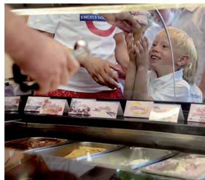
31 jongens en meisjes deden in Blaricum in 2012 mee aan het Summer Camp 'Engels voor Bengels'.

Locatie: OBB Data: 8 t/m 12 juli. Tijd: 9.00 tot 16.00 uur. Doelgroep: Groep 1, 2 t/m groep 8