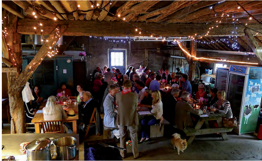
Lionsclub Blaricum-Laren organiseerde op 23 juni in de aspergeboerderij voor 70 belangstellenden een Dorpslunch. Voor de goede doelen Stichting Redcapa (verbetering van leefomstandigheden in Ghana), Nationaal Ouderenfonds, Gemeenschapsfonds Blaricum en de E.H.B.O.-Vereniging Blaricum werd een kleine 4.000 euro bij elkaar gesmikkeld.