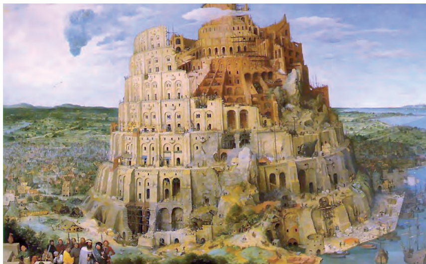
De 'kleine' toren van Babel (1563) geschilderd door Pieter Breugel de Oude