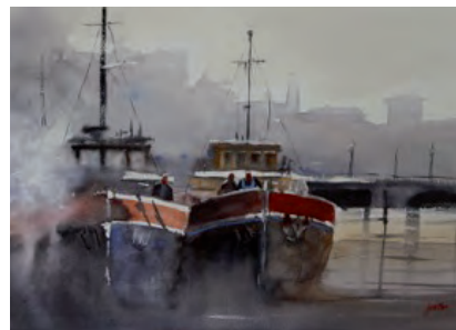
Boten aan de Amstel van Jan Min

De opening van de expositie is op zaterdag 12 juli van 17.00 tot 20.00 uur. De expositie is te bezichtigen van dinsdag tot en met zaterdag van 10.00 tot 17.00 uur.