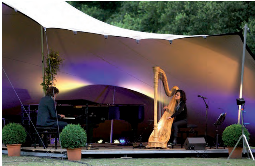
Nederlands bekendste harpiste Lavinia Meijer verzorgde samen met pianist en componist Michiel Borstlap een bijzonder optreden tijdens het Zomerconcert bij Rust Wat.