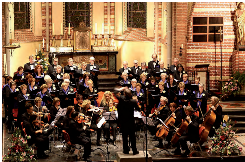
Blaricums Gemengd Koor tijdens het 25-jarig jubileum in de Vituskerk

Info en/of aanmelden: Janny Hospers, e-mail: jhospers@versawelzijn.nl .