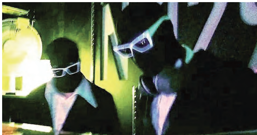
Funk Disorder were dressed in their magic man Lyra suits of another kind (with real sunglasses at night) but they gave a great set. Tekst en foto van Victoria Aitken op de Engelse blog.