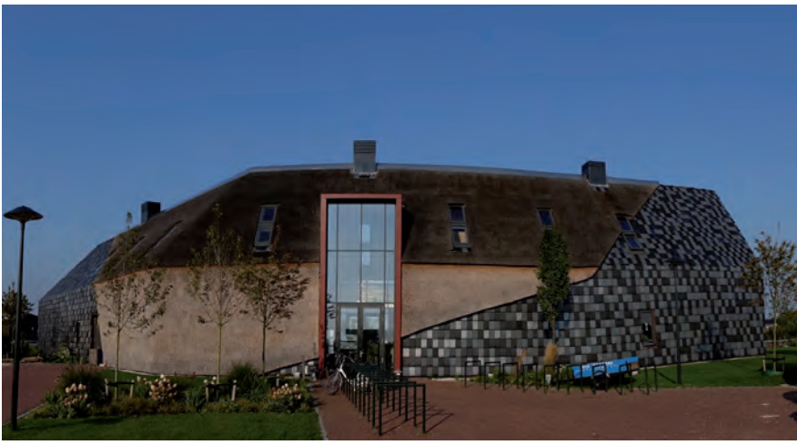
vonden en tentoonstellingen.