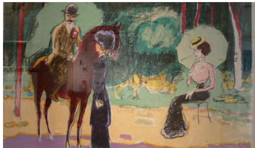
De Ontmoeting, ontmoeting in het bos. Kees van Dongen circa 1950.

Met schilderijen, foto's, beelden, films heb ik ook ontmoetingen. Afgelopen jaar heb ik de schilder Kees van Dongen 'mogen ontmoeten'. Althans zijn werk, hij is overleden in 1968. Hij was kunstschilder, beeldhouwer en pottenbakker. Hij schilderde, aquarelleerde, tekende (pastel) en lithografeerde. Hij is vooral beroemd geworden door zijn portretten en vrouwelijke naakten. Inmiddels hangen er twee van zijn werken in mijn woonkamer. En ik sluit zeker niet uit dat er meer zullen volgen. Nadenkend over ons kersthema Ontmoetingen, blader ik nog eens zijn door zijn oeuvrecatalogus en stuit op het schilderij De Ontmoeting. Het is nog te koop.