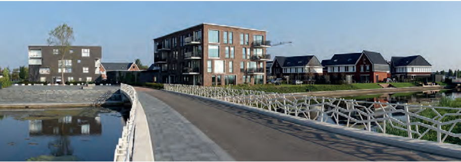
, gisteren hadden we hier thuis nog de vergadering en we hebben ook buurt BBQ's.'