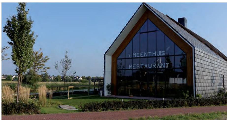
't Meenthuis - 'Men weet ons tegenwoordig beter te vinden. We organiseren succesvolle muzie...