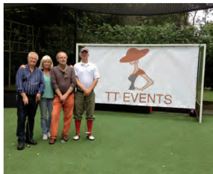
Een hole bij TT Events van het Blaricumsche Golf & Country toernooi

TT Events heeft een breed aanbod en een uitgebreid netwerk zodat met Tera veel te regelen valt. Tera: 'Ik neem in ieder geval alle stress en zorgen weg van de organisatie en coördineer de happening tot in de puntjes, zodat men volledig en onbezorgd kan genieten! TT Events levert altijd maatwerk, gebaseerd op de wensen van de klanten. Ook wanneer het budget beperkt is, kan ik toch een gedenkwaardig evenement organiseren. En als de klant absoluut geen financiële rompslomp wil, dan beheer ik het budget en betaal uit "deze pot", zodat men zeker weet dat we binnen het budgetkader blij-