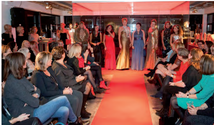
Modeshow georganiseerd in samenwerking met o.a. Seconda en Gall & Gall