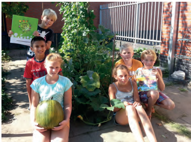
De moestuin van 'de Levensboom'

De Levensboom is oorspronkelijk een Protestants Christelijke school, maar inmiddels wordt deze levensbeschouwing breder getrokken naar de meer algemeen geldende normen en waarden voor burgerschap, sociaal emotioneel gedrag en goede omgang met elkaar. De leerlingen doen regelmatig mee aan projecten voor goede doelen. Het soort leerlingen op de school is heel divers; het is een echte