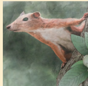
Patrick Lynch / Yale Unit

's Ochtends vroeg loop ik langs de voederplek op ons terras. De heggenmussen schrikken op en zoeven massaal weg. En de eekhoorn? Die blijft gewoon zitten. Voorover gebogen op zijn plankje. De volle, dikke staart statig omhoog gekruld. Knabbelend aan een pindanoetje dat hij rondraait in zijn voorpootjes. Zijn net handjes. Het kaakje gaat razendsnel op en neer. De vlijmscherpe voortandjes snel afslijtend. Geen probleem: de jaarlijkse tandgroei is zo'n tien centimeter. Een harmonisch evenwicht tussen groei en gebruik. Ik blijf stokstijf stilstaan. Kijk vanuit mijn ooghoeken naar het diertje. Abrupt stopt hij met zijn geknabbel. Richt zich op. Nieuwsgierig staren zijn donkere oogjes mij aan. Zou hij wegvlugten, het dak op? Een spannend moment. Nee, hij blijft zitten. Roerloos bekijken we elkaar. Er is iets bijzonders tussen ons. Niet alleen opgebouwd vertrouwen. Dan zeg ik: 'Zo, makker, tot ziens maar weer, het ga je goed' en loop voorzichtig verder. Zijn kopje zakt weer omlaag en hij gaat druk door met zijn knabbelwerk... Ja, wij kennen elkaar. Inderdaad, al héél lang. Uit recent paleontologisch onderzoek in Montana (US) blijkt dat de mensachtigen en de eekhoorns een gezamenlijke stamvader hebben, de Purgatorius.