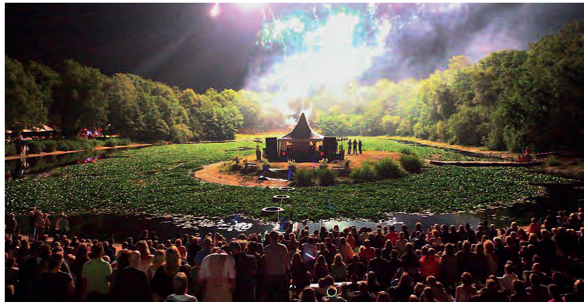
Vuurwerk bij Rust Wat

Ieder huishouden krijgt één exemplaar. Zolang de voorraad strekt is er een mogelijkheid om extra exemplaren te bestellen. Dit kunt u doen via de website www.debijvanck.nl tegen betaling van € 2,50 per stuk.