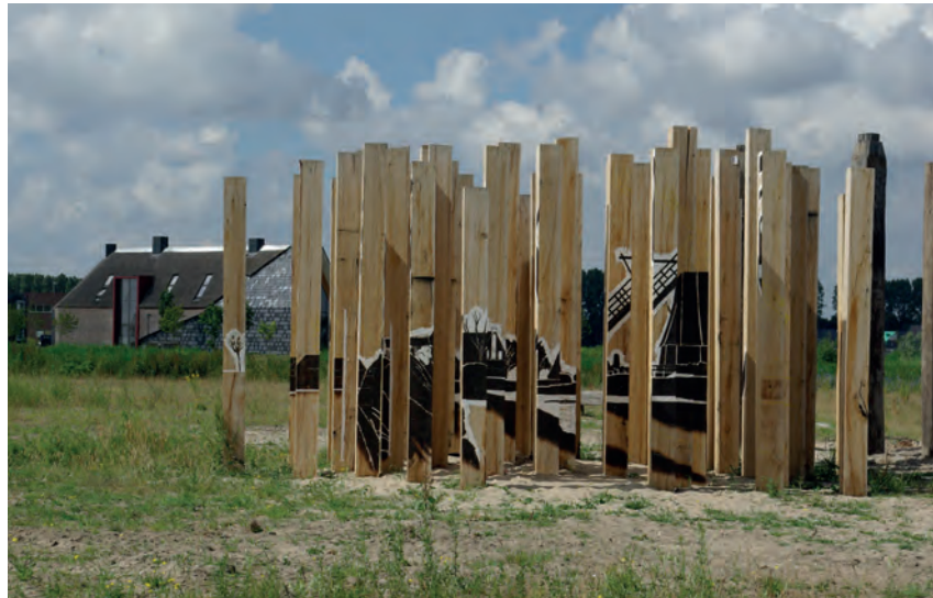
't Tussenom. Dit kunstobject beschouwt de Blaricummeent in het perspectief van de tijd. Op het object worden door beeldend kunstenaar Marco Goudriaan afbeeldingen aangebracht (ingebrand).

Voor uitgebreide informatie zie www.ovblaricum.nl