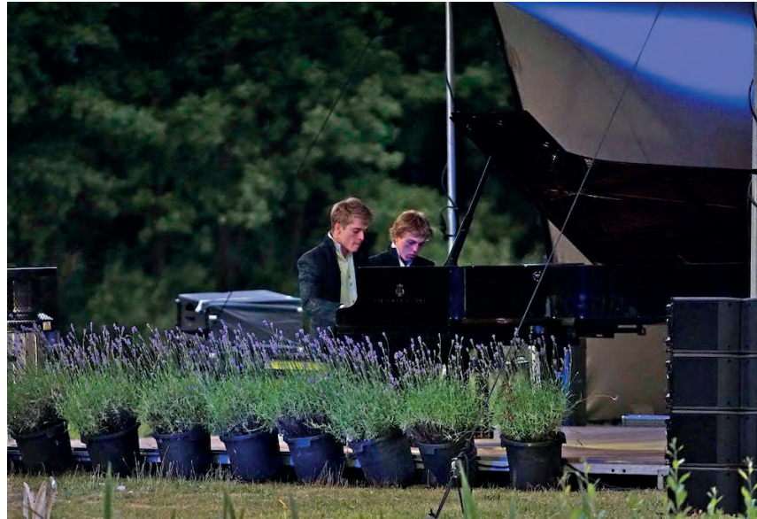
Lucas en Arthur Jussen, Papageno Zomerconcert 2016 bij de vijver van restaurant 'Rust Wat'

Het boek is voor € 5,- te koop bij de Gooise boekhandels. Recentelijk hebben alle schrijvers bij boekhandel Los (Bussum) 'hun' boek gesigneerd. De 16 verhalen geven een inkijkje in de fantasie- en de belevingswereld van de schooljeugd.