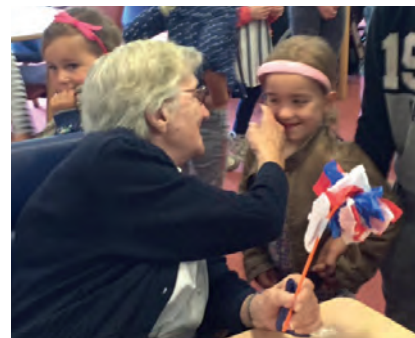
Het overhandigen van geluk

pen via internet, knutselen voor de kerstmarkt en een springtouw-sponseractie. Het geld wordt besteed aan twee mooie bloemen/planten-tafels, waar de mensen met een rolstoel ook gebruik van kunnen maken, en ook het terras bij het restaurant krijgt een metamorfose. De kinderen van de school gaan de komende periode zeker nog eens kijken hoe het terras is geworden en of de planten en bloemen in de tafels extra water nodig hebben.