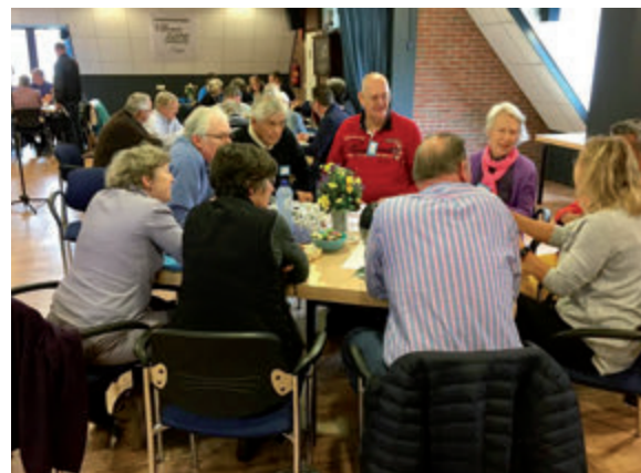
Meer dan 50 deelnemers gaven hun mening en ideeën voor de Dialoog

Die betrokkenheid bleek ook in april bij een vervolgsessie op de Dialoog over Blaricum die we ook in 2016 met u voerden. Een hoge opkomst zorgde voor een mooie en inspirerende zaterdag in de Blaercom. Een aantal werkgroepen zijn met de daar besproken onderwerpen aan de slag gegaan. Het is soms nog wel een beetje zoeken hoe we nu als inwoners en gemeenten in gezamenlijkheid kunnen werken aan belangrijke verbeteringen voor ons dorp.