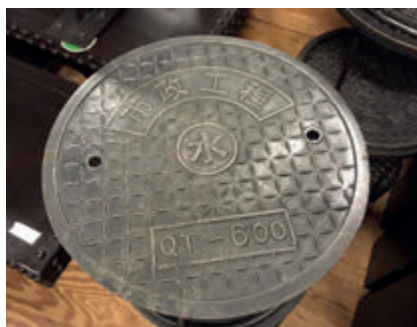
Chinese putdeksels als sidetables

Houd de website in de gaten: www.cha-asiancomfortfood.nl , tel. 035-7620999.