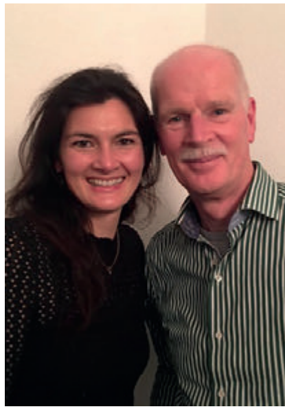
Vader en dochter Wiersema, huisartsen gezondheidscentrum Bijvanck

'Stoppen met mijn huisartsenpraktijk/werk is niet iets waar ik direct vrolijk van word. Ik heb met velen van u een vertrouwensband opgebouwd. (...) Het is onbeschrijflijk wat ik in al die jaren met u heb meegemaakt: geboortes, ziek-