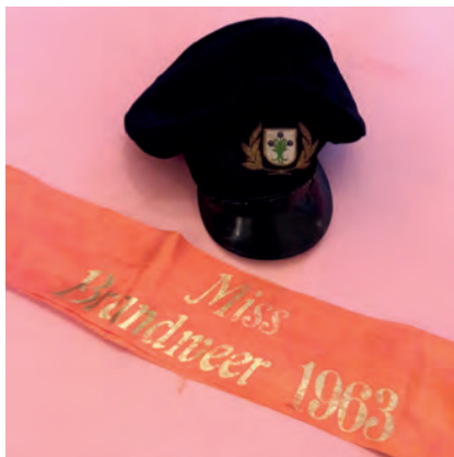
De brandweerpel en de sjerp van miss Brandweer 1963

sjerp, zoals dat hoort bij een miss-verkiezing. Deze werden uitgereikt door niemand minder dan de Blaricummer Tom Manders, alias Dorus, die met zijn 'hoestbui op vier wielen', zo noemde hij zijn oldtimer, de tent in kwam rijden.