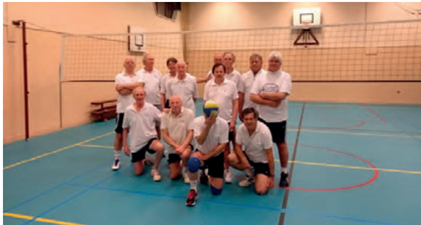
De Ballegooiers bestaan 35 jaar