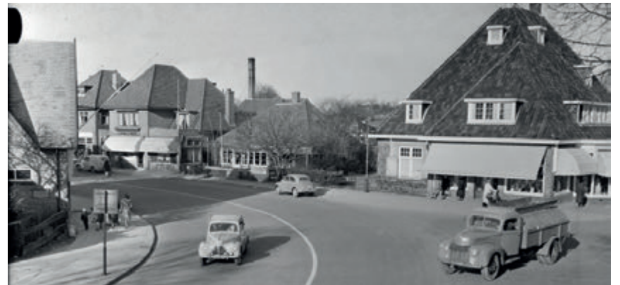
Huizerweg - Torenlaan 1952