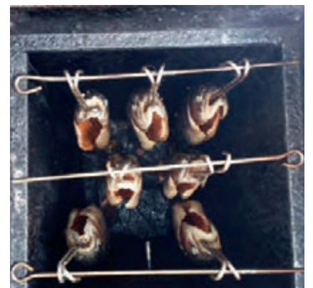
Vissen in de rookton