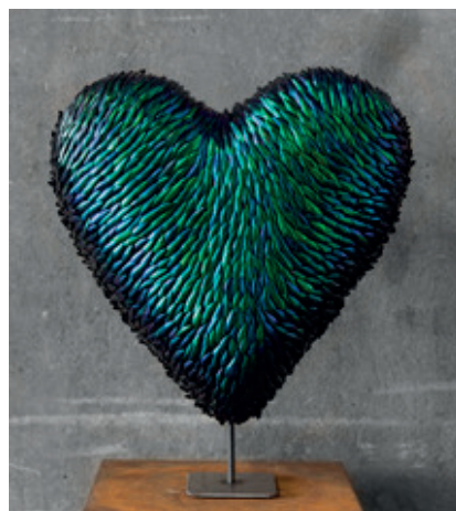
Luxury in love - van jezelf en je passie houden