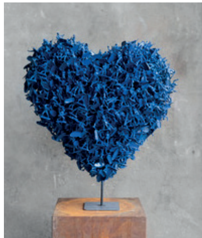
Make Love, not War - vechten voor liefde