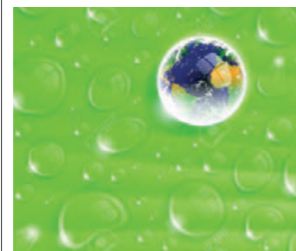
Dauwdruppel met de aarde - Liviu Peicu

U begrijpt dat mijn jonge hond en ik hier nog een beetje mee worstelen, maar we zijn wel blij. Ik wens u allen een goed einde en een kleurrijk, gezond en ook een blij 2019.