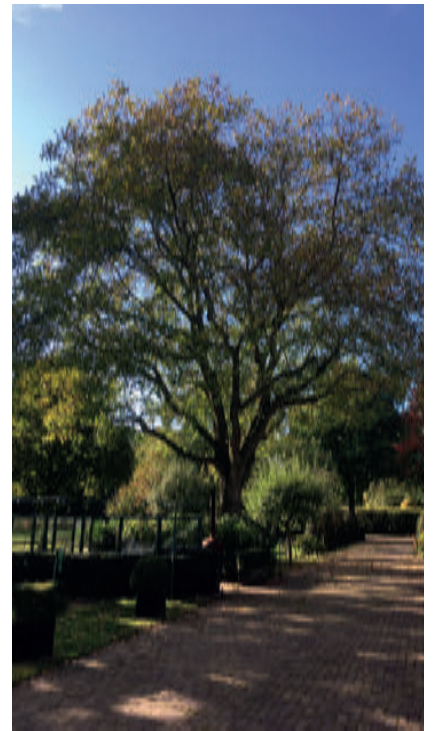
De notenboom, teken van vruchtbaarheid

Ik wens u en de uwen een heel vredige kerst en een gezond en inspirerend 2019 toe.