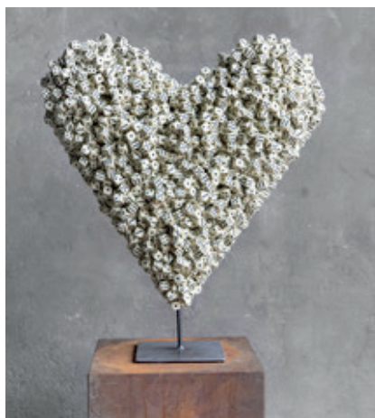
Lucky in Love - liefde is niet vanzelfsprekend