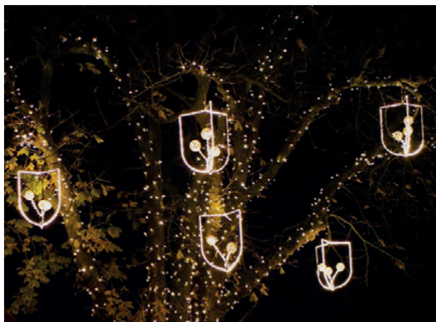
De Blaricumse lantaarns

35 prachtige Blaricumse lantaarns hangen verspreid in de bomen van het oude dorp, een ontwerp naar het wapen van Blaricum van architect Djelko van Es. Het schild met drie korenbloemen is uitgevoerd in 2D en de lantaarns zijn een uitwerking van dit schild in 3D.