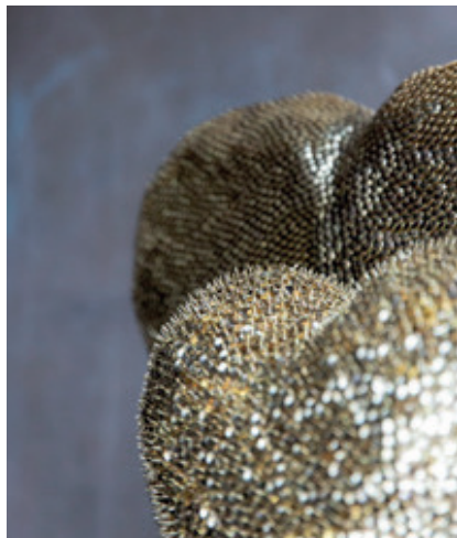
Protective Love - beschermende en onvoorwaardelijke liefde