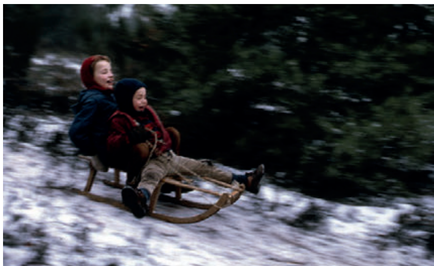
Op de foto uw facebookredacteur achterop bij zijn broertje. Jeugdherinneringen. Tafelbergheijtje. Winter 1970-1971

Op een vrolijk, flitsend, fris & fruitig nieuw jaar! Ervaar de balans van twintig-twintig en geniet in goede gezondheid.