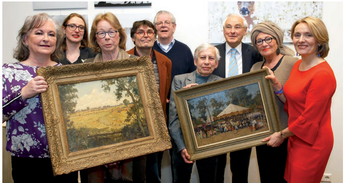
De overdracht van het beheer van de gemeentelijke kunstcollecties naar de nieuwe stichting Beheer kunstcollecties Blaricum en Laren.

Een mijlpaal was ook het onderbrengen van de kunstcollecties van Blaricum en Laren in een stichting. Heel belangrijk om zo het beheer van deze mooie collectie te borgen voor de toekomst, zodat we zeker weten dat iedereen ervan kan blijven genieten.