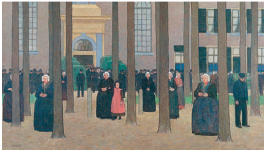
Singer - Uitgaan van de oude Sint Janskerk in Laren, Gijs Bosch Reitz 1893

reld. Stillevenen. Besloten tuinen. Het interieur van een schildersatelier. Religieuze thema's. Dat prachtige schilderij uit 1893 van Gijs Bosch Reitz hangt er. Het uitgaan van de oude Sint Janskerk, met al die zwarte figuren, alleen twee meisjes dragen rood, die zich zwiingend verspreiden over de Brink. Evenals zijn drieluik van de Sint Jansprocessie. Met die weerbarstige