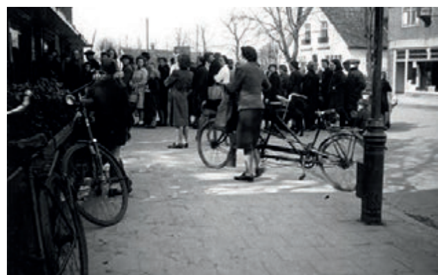
Voor de kruidenierswinkel van Oversteegen