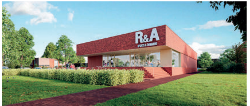
Het R&A Sports & Swimming gebouw is ontworpen door Van Slangen+Koenis Architecten

De planning is dat het nieuwe bad in de Blaricummermeent in april 2021 opengaat. Het kleine bad in de Bijvanck